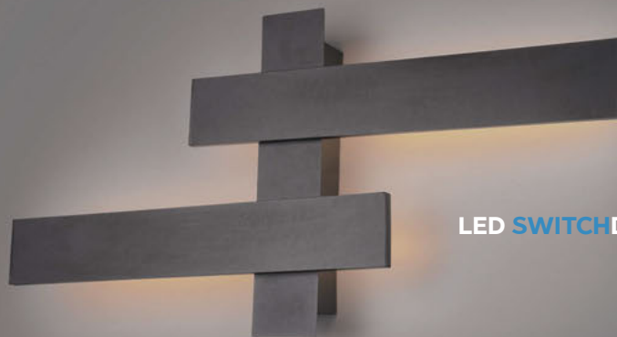
LED SWITCH DIMMER