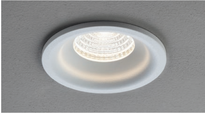
MWH Mat White