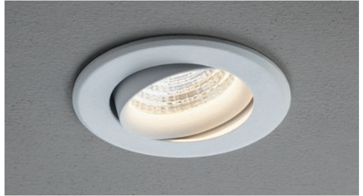
MWH Mat White