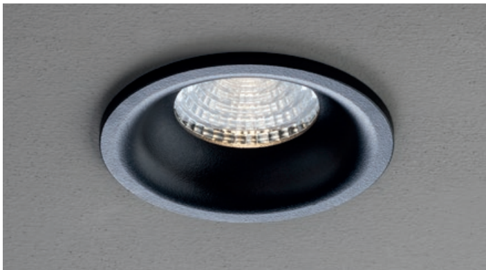
MBK Mat Black