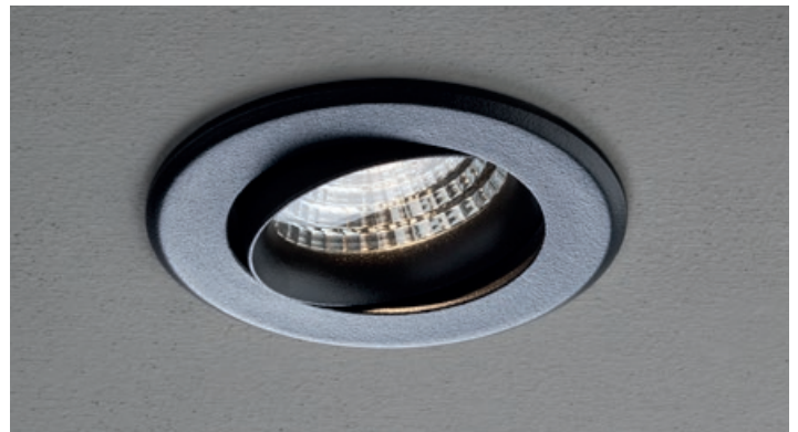
MBK Mat Black