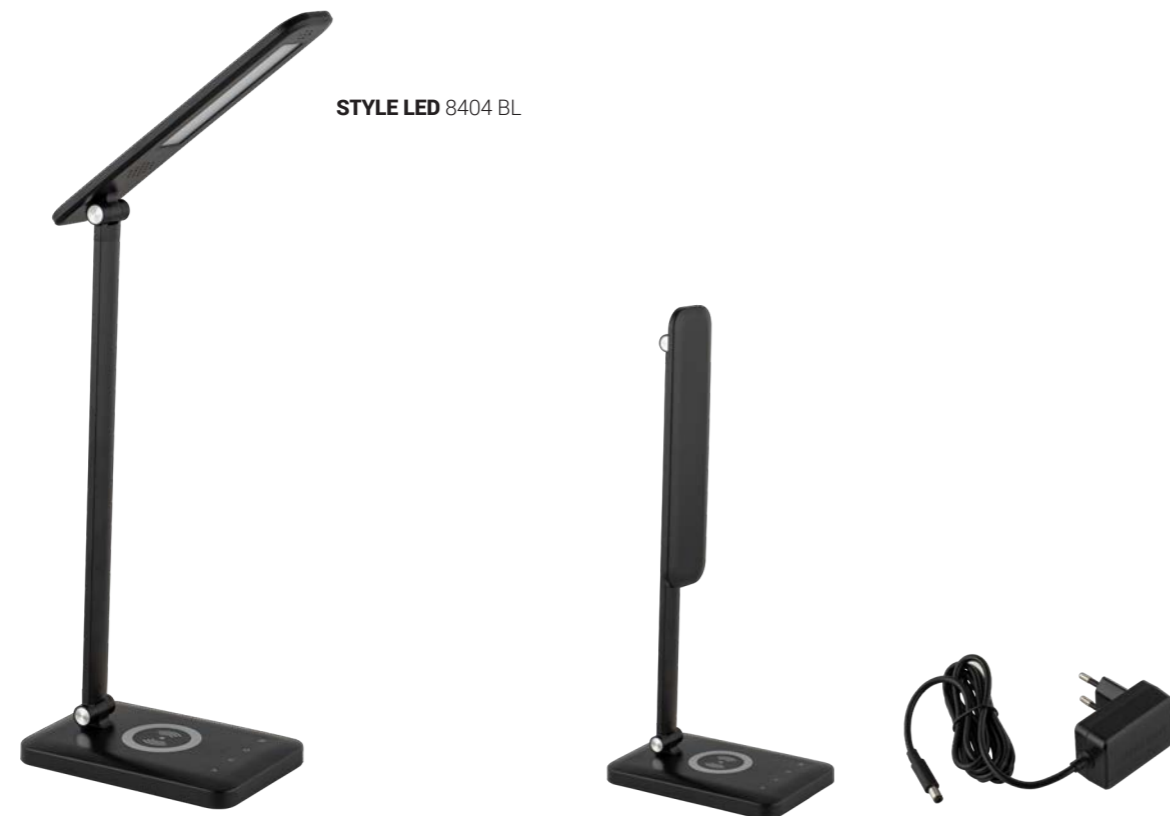
STYLE LED 8404 BL