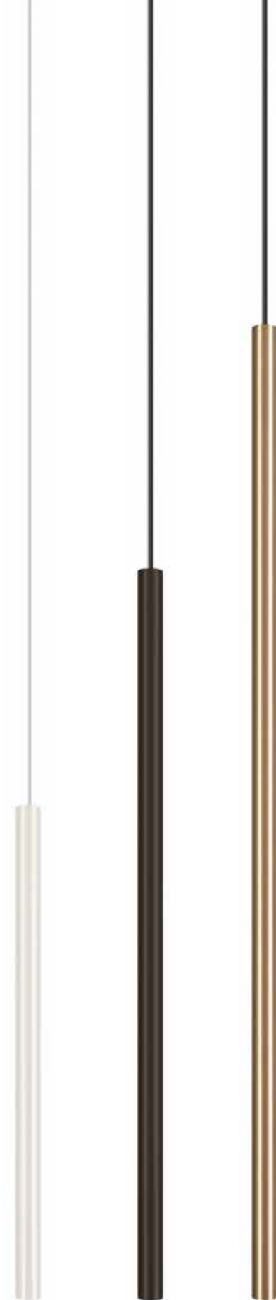
CAMELEON LASER 490 8573 WH

brass / miedz / латунь 8486 ● BS works with / zastosuj z / применять с Ⓛ 1× CAMELEON CABLE G9