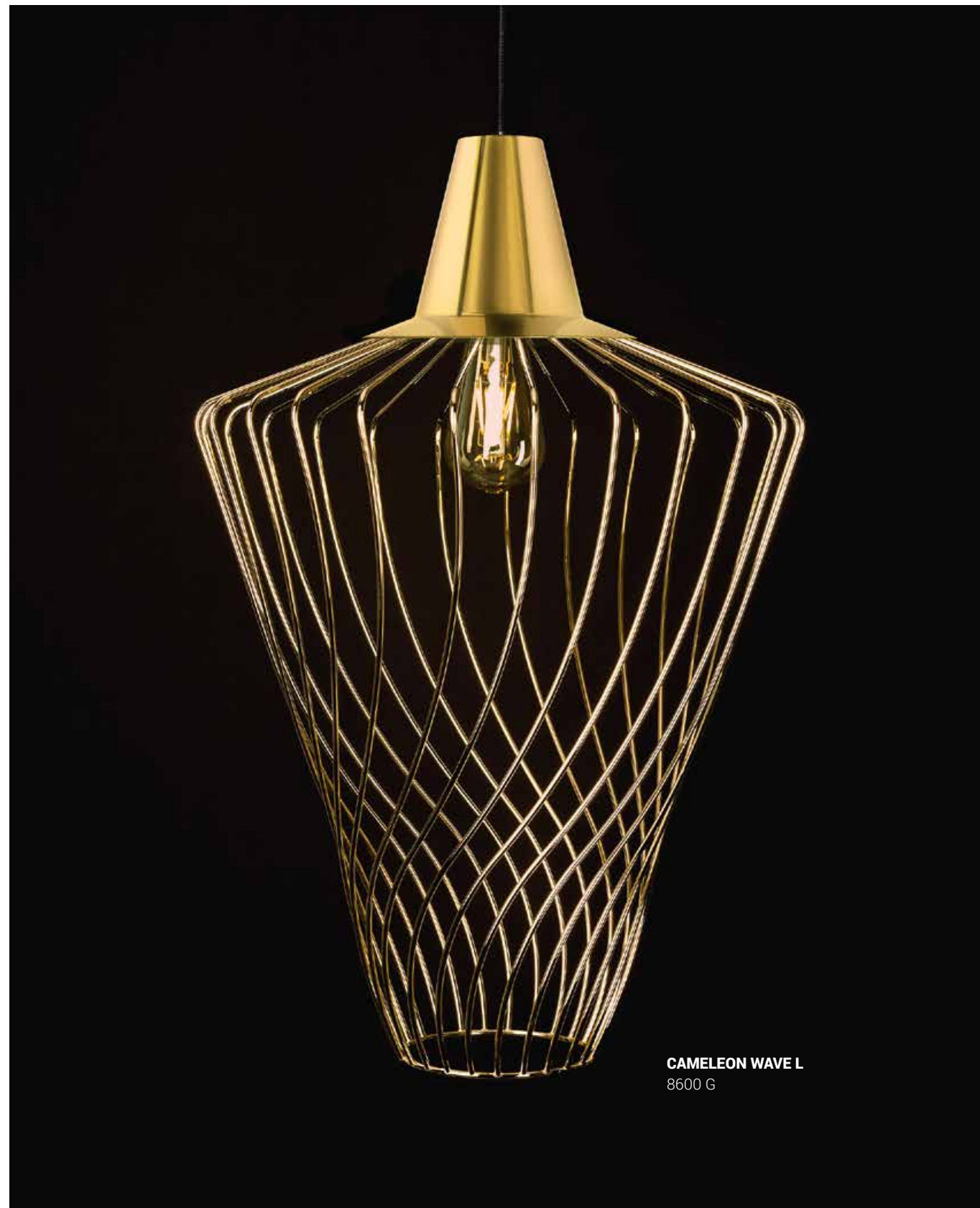
CAMELEON WAVE L 8600 G