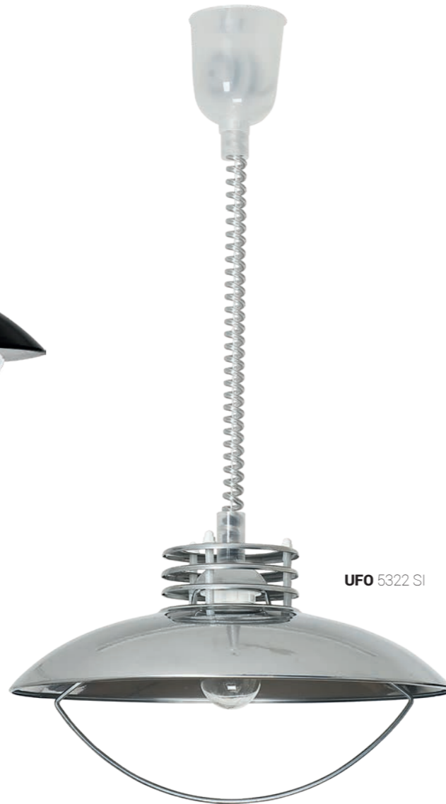
UFO 5322 SI