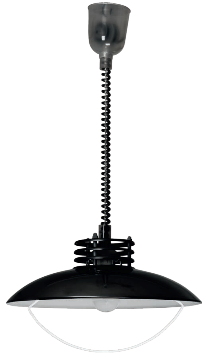
UFO 050/01 BL