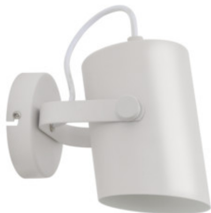
LARATA EL-10 W