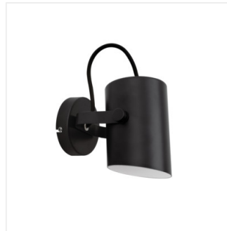
LARATA EL-10 B