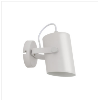
LARATA EL-10 W