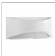
BISO LED EL 8W-W