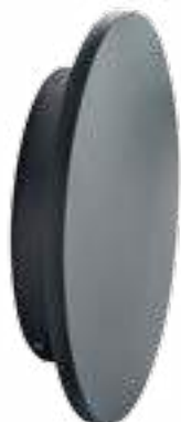
FORRO LED EL 8W-GR