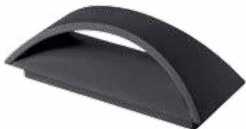
BISO LED EL 8W-GR