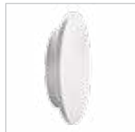
FORRO LED EL 8W-W