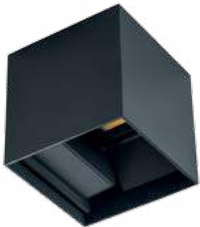
REKA LED EL 7W-L-GR