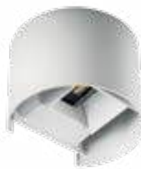
REKA LED EL 7W-O-W