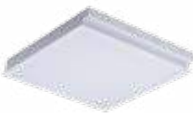
REGIS 4LED OPAL 418PT