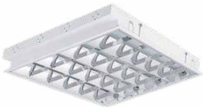
REGIS 4LED 418 PT