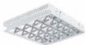
REGIS 4LED 418 PT