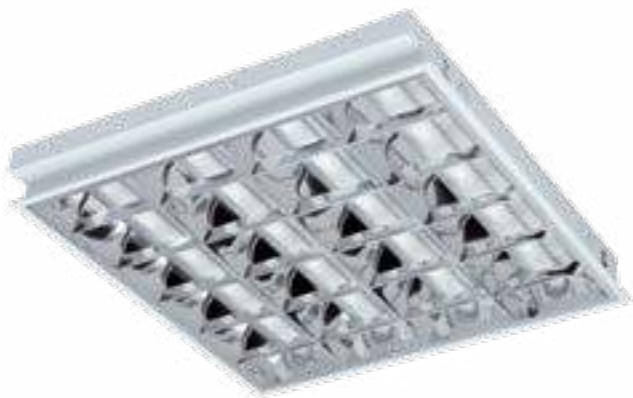
REGIS 3 EVG 418 PT / REGIS 3WS EVG 418 PT