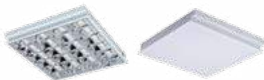
REGIS 3 EVG 418 PT; REGIS 3WS EVG 418 PT