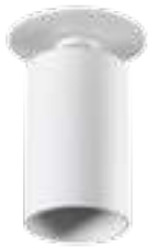
CHIRO GU10 DTO-W