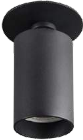
CHIRO GU10 DTL-B