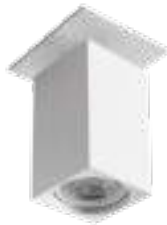
CHIRO GU10 DTL-W