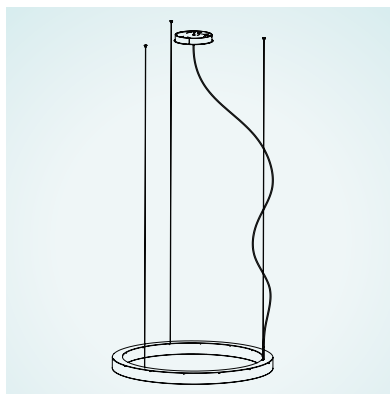
ABHÄNGUNG: 2 SUSPENSION: 2 SUSPENSION: 2