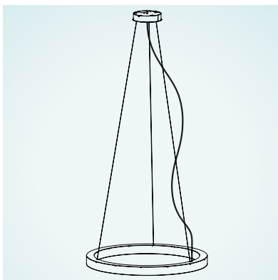
ABHÄNGUNG: 1 SUSPENSION: 1 SUSPENSION: 1