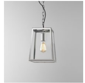
CODE: 1306014 FINISH: POLISHED NICKEL

THIS PRODUCT IS NOT SUITABLE FOR INSTALLATION WITHIN FIVE MILES OF THE COAST. FOR THESE ENVIRONMENTS, PLEASE FILTER PRODUCTS ON THE ASTRO WEBSITE BY 'COASTAL'.