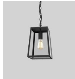
CODE: 1306013 FINISH: TEXTURED BLACK